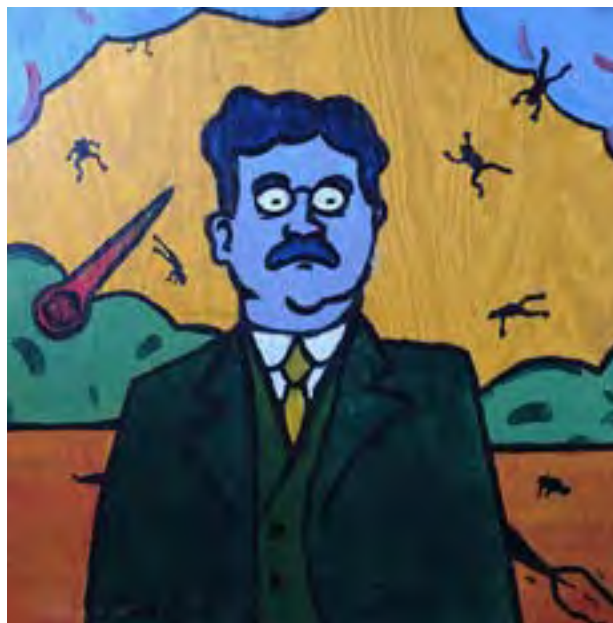
Portrait de Charles Fort réalisé par l'artiste américain Andy Finkle (avec l'aimable autorisation de l'éditeur Québécois de Charles Fort).

Il explique: «Je collectionne les notes qui témoignent d'une diversité: les excentricités du cratère Copernic, la soudaine apparition d'Anglais bleus, les radiants de pluies de météores qui semblent tourner avec la Terre, l'observation d'une pousse de cheveux sur le crâne dégarni d'une momie... On est en droit de se demander si la fille a